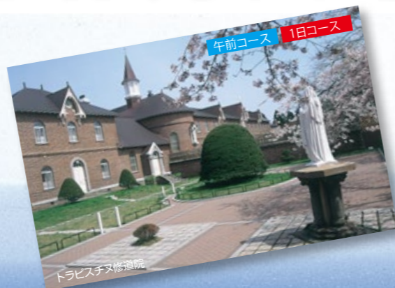
トラピスチヌ修道院