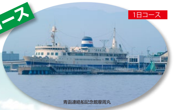
青函連絡船記念館周丸