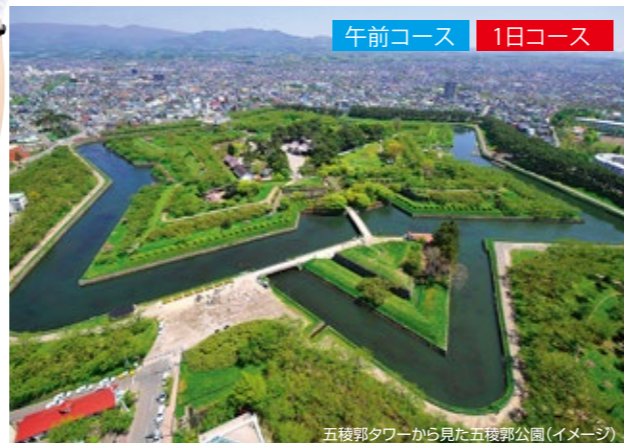
午前コース 1日コース