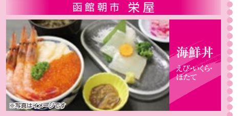
海鮮丼 えび・いくら はたて