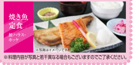
焼き魚 定食 鮭ハラス ホッケ