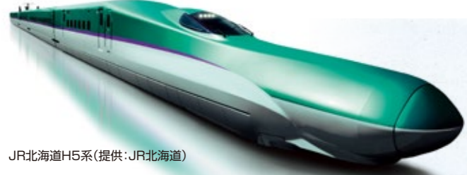
JR北海道H5系