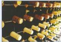
地下二あるワインセラーには、リクエストに対応する多彩なワインが用意されています。