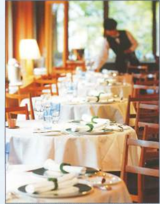
自ら厨房の掃除を行っているシェフが創り出す、季節を感じさせる数々のフレンチメニューは、多くの人々から高い評価を受けています。