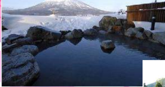
羊蹄山を間近に眺めながら、温泉でゆったり！