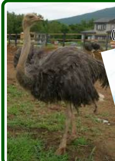
ダチョウ農園 (マルヤマヒーリングファーム)