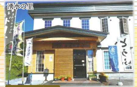
手づくりの味わい こだわりの職人の技でつくることができた豆腐のお店です。