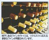
地下二あるワインセラーには、リクエストに応える多彩なワインが用意されています。