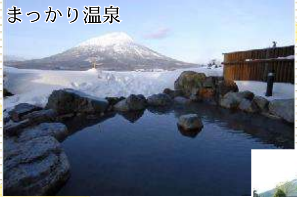
羊蹄山を間近に眺めながら、温泉でゆったり！