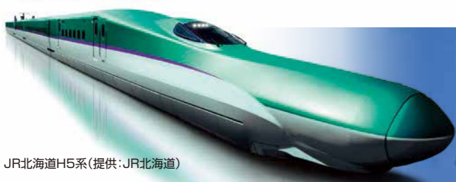
JR北海道H5系