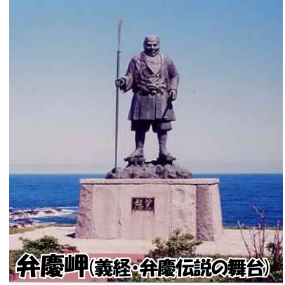
弁慶岬(義経・弁慶伝説の舞台)