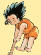
寿都町マスコットキャラクター「風木」