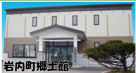
岩内町郷土館 北海道内でも古い歴史を持つ岩内町の 貴重な展示品が見学できます