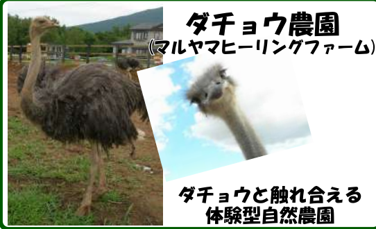
ダチョウ農園 (マルヤマヒーリングファーム) ダチョウと触れ合える 体験型自然農園