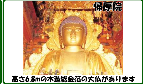
帰厚院 高さ6.8mの木造総金箔の大仏があります