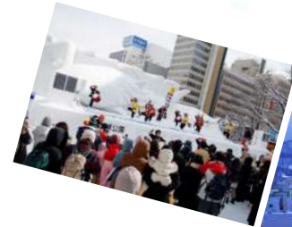
さっぽろ雪まつりの様子 (イメージ)