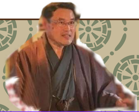
バス車内で荒到夢形さんの講演が楽しめます

そばの花が海のように一面に広がる中央に舞台を設け、国の重要無形民俗文化財である「松前神楽」の舞が堪能できます。