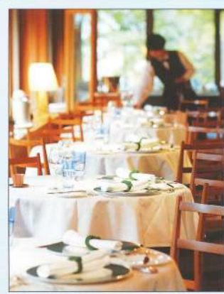
自ら厨房の掃除を行っているシェフが作り出す、季節を感じさせる数々のフレンチメニューは、多くの人々から高い評価を受けています。