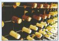
地下二あるワインセラーには、リクエストに対応する多彩なワインが用意されています。