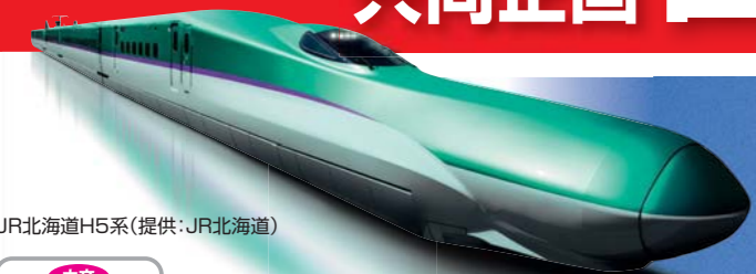
JR北海道H5系