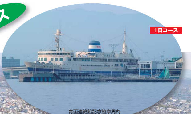
青函連絡船記念館摩周丸