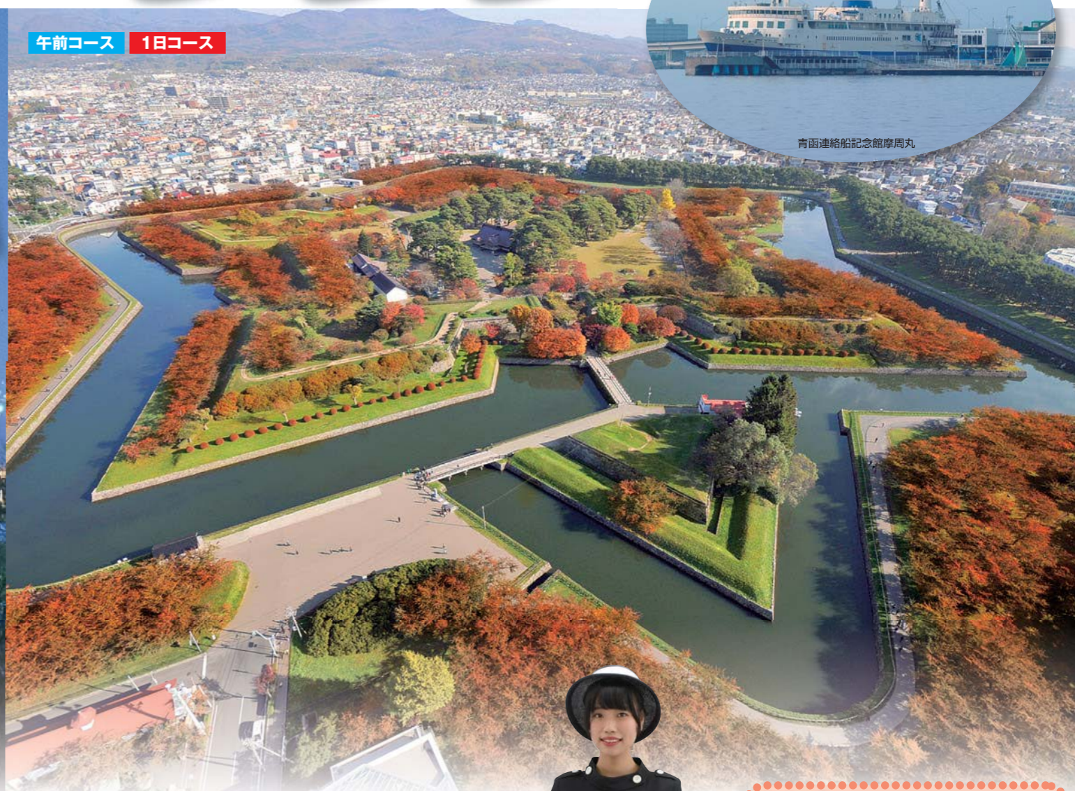
五稜郭タワーから見た五稜郭公園(イメージ)