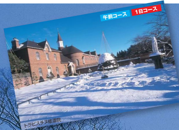
トラピスチヌ修道院