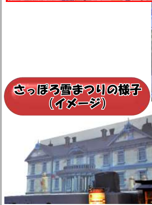
さっぽろ雪まつりの様子 (イメージ)

* 募集人員45名 (最少催行人員15名) * 最少催行人員に満たない場合、催行しないこともございます。 * 事前予約制となります。ご予約は催行募集日の2ヶ月前より承ります。 * 催行の有無は1週間前に電話でご連絡致します。 * キャンセルの場合は、ご出発予定日の2日前の18:00までにお電話にてご連絡をお願い致します。 * 上記を過ぎた場合のキャンセル料は、いかなる場合も前日は50%、当日は100%発生致します。 * 混雑時はご相席になる場合がございますのでご了承ください。 * 当日の天候及び交通状況により、コースの変更、遅れ等が発生することがございます。予めご了承下さい。